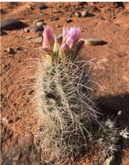
Sentier vers Corona Arch

Nous partons faire la route panoramique 279 direction Potash dans un sentier tout en fleurs (voir les photos de gauche) pour se rendre à la Corona Arch que nos amis ont déjà fait. (photo