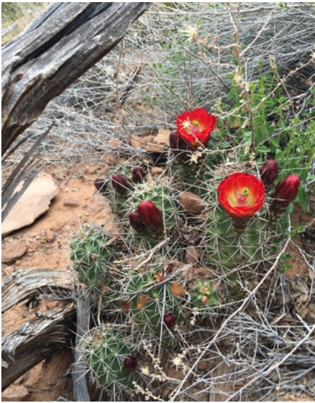
Cactus en fleurs Wow