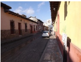
Rues étroites de San Cristobal

Ville de plus de 250,000 habitants, fondée en 1528, la plus vieille ville espagnole du Chiapas sise à 2150 mètres en altitude, entourée de montagnes, elle se veut attrayante par son architecture et ses rues caractéristiques, très étroites. Aucun gros édifice ne vient briser le charme de ses jolies petites maisons colorées. Et comme partout au Mexique, nous y retrouvons un grand nombre d'églises.