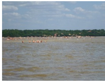
Les flamands roses par centaine

Quelques-uns ont réussi à trouver l'endroit où il y a des centaines de flamands roses. Et ce n'est pas parce que les autres n'ont pas essayés. Voici d'ailleurs quelques photos.