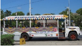
L'autobus des touristes New-West

Et en après-midi, le groupe se disperse pour découvrir d'autres facettes de Merida. Bon nombre se retrouvent au Musée du monde Maya, un grand musée moderne à quelques minutes à pied du camping. Super intéressant sur la culture maya n : de l'écriture à la religion, à la vie quotidienne... Avec de montages et des artéfacts qui nous permettent de bien comprendre. Apprécié !