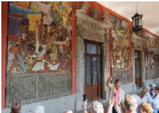
Des fresques géantes au Palais National

Nous visitons d'abord le Palais National dans lequel nous admirons les fresques géantes du peintre Diego Rivera. Elles illustrent l'évolution du Mexique des temps anciens à la révolution puis l'Indépendance. Plus de deux cents personnages meublent ces fresques. Nous sommes tous impressionnés. Et que dire des magnifiques jardins qui parent la cour intérieure... Détail intéressant : la fontaine centrale du Palais est le kilomètre 0 de toutes les routes du Mexique.