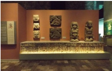
Des artefacts superbes sur les peuples qui ont développé le Mexique

En P.M., c'est le Musée de l'anthropologie. Il faudrait deux jours pour tout voir, mais avec le peu de temps qu'il nous reste nous y allons donc rapidement en prenant de nombreux clichés. Le guide explique l'ensemble, mais la partie Aztèque l'intéresse davantage, parce que plus régionale de Mexico et également plus récente avec l'arrivée des Espagnols. Pour vous donner une idée de l'ensemble, ce musée, construit en 1964, est l'un des plus beaux au monde. Un musée moderne sur deux étages et qui a rapatrié avec le temps les plus belles pièces découvertes dans les temples, les tombes, partout au Mexique, sur l'histoire des civilisations qui ont développé l'Amérique, tant du Sud que Centrale. Divisé en salles thématiques, on passe des origines de ces civilisations aux Toltèques, Olmèques, Aztèques, Mayas et j'en passe... En tout vingt-cinq galeries de pièces archéologiques originales. Magnifique !!