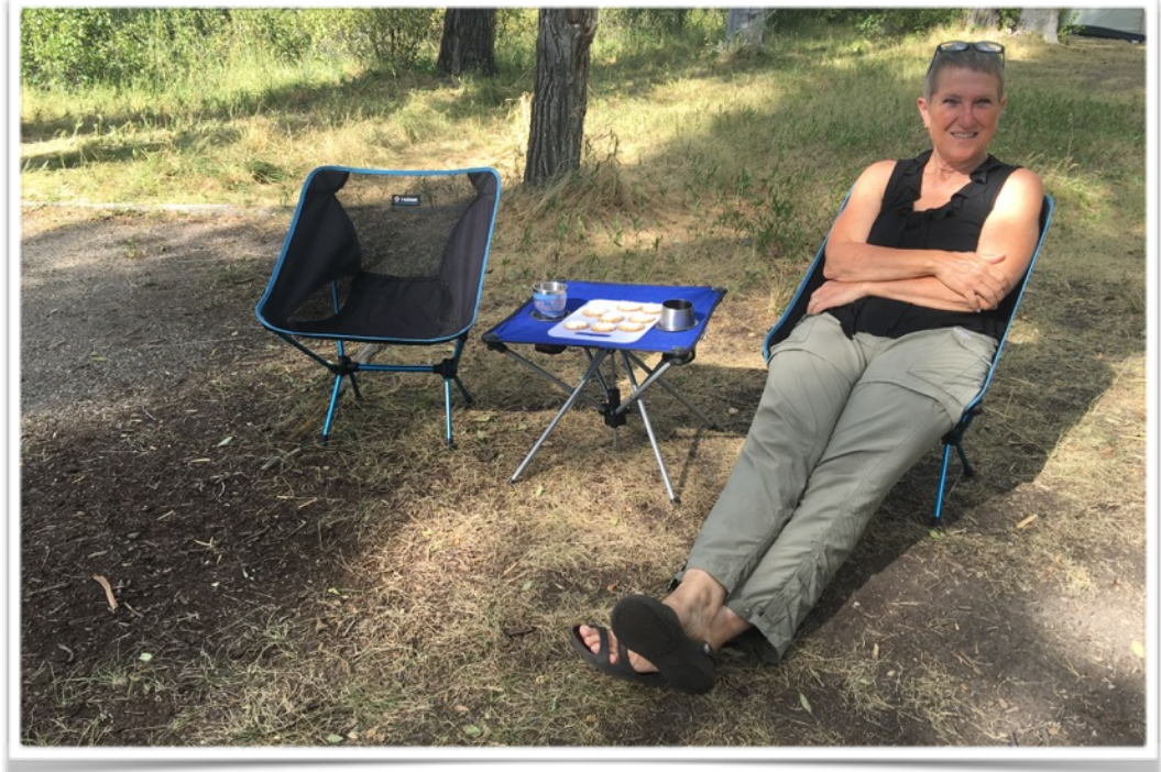
Notre premier apéro sur notre nouvelle table

Tx incluses c'est un achat assuré et toute une économie. (voir photo ci-dessous)