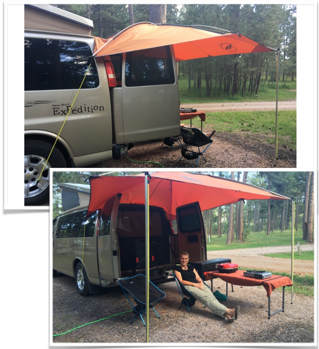
Portes arrières ouvertes, à l'abri du soleil et panneaux solaires plein Sud-Ouest

Test concluant alors quand la situation le permettra.