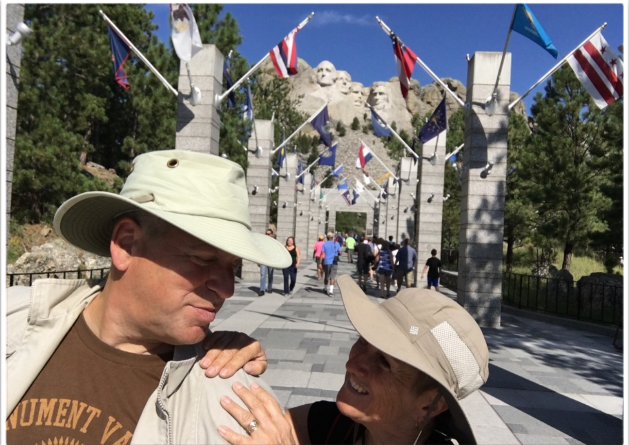
À l'entrée du Mont Rushmore