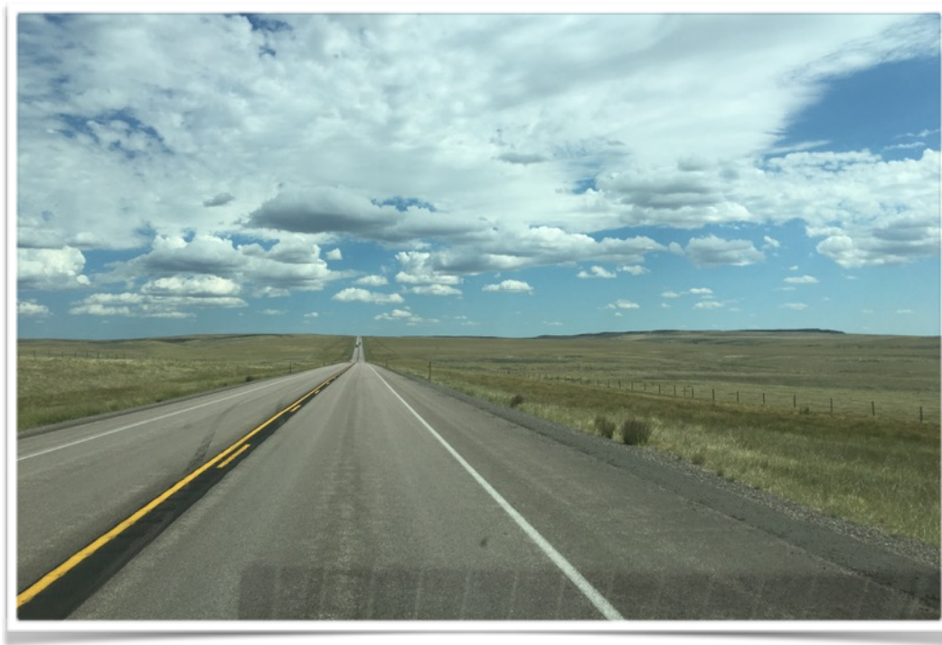
La longue traversée du Wyoming par la US 26 jusqu'à Casper

Une pause, quelques changements de route et nous voilà rendu dans le Dakota du Sud.