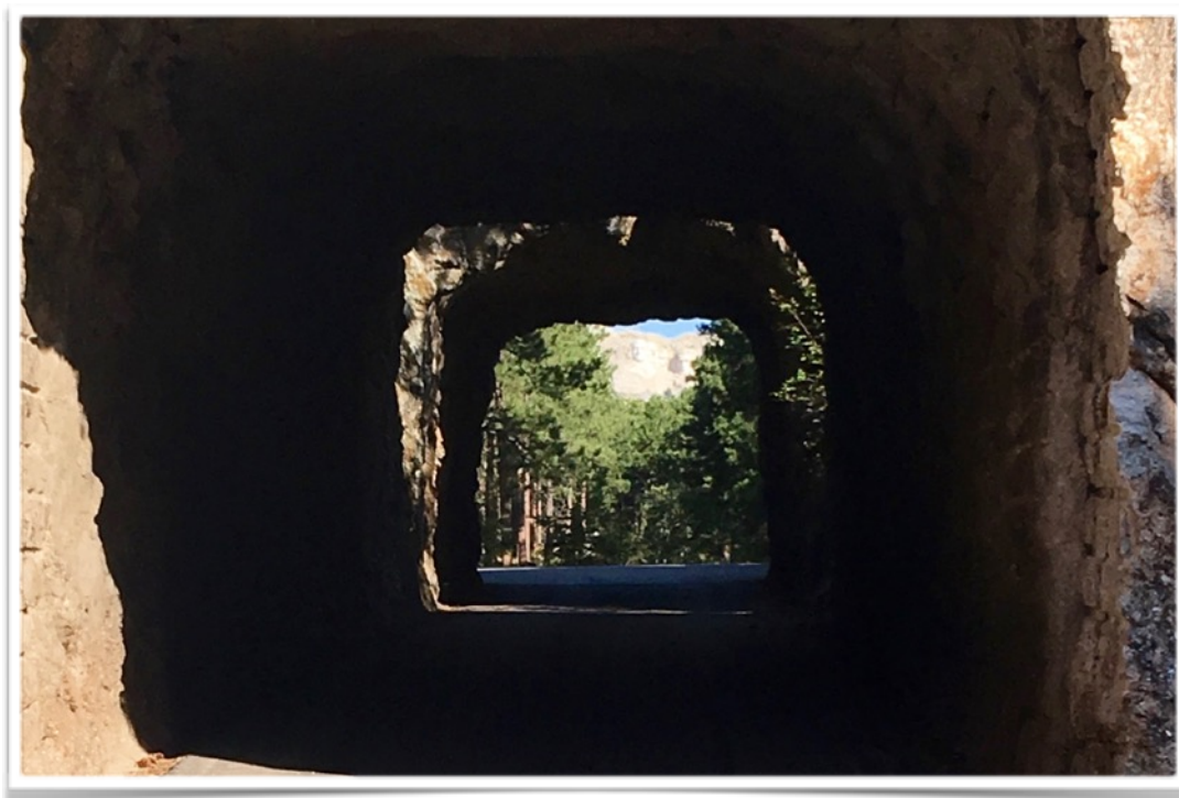
Tout au fond le Mont Rushmore.

Après ce superbe paysage en serpentins nous arrivons sur la 16A pour un autres 18 miles (apx. 38 km), pour passer dans 3 tunnels de dimension restreinte d'où nous pouvons y voir le Mt Rushmore à la sortie. (voir photo ci-dessous)