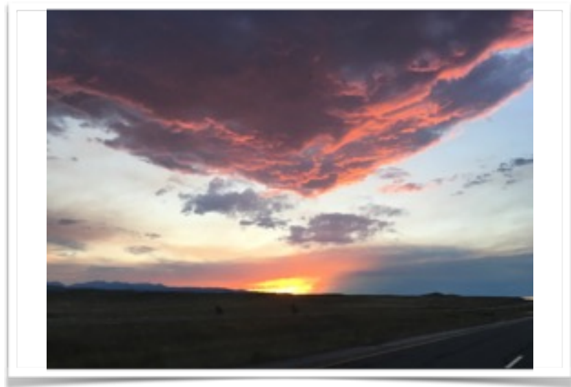
La route est belle ainsi que le coucher du soleil

Direction (Photo ci-haut) vers le Truck Stop à Buffalo WY, une nouvelle chaîne que nous n'avions jamais essayée; celle-ci se nomme CENEX. À notre arrivée à 21 heures 30, non loin de la I-90 sur la route 16, nous l'apercevons; ho-ho c'est petit; aucune vanne dans le stationnement et ça a l'air fermé; pourtant, notre livre de Next Exit, édition 2016 en plus, nous indique que c'est ouvert 24 heures sur 24. Bizarre..... Nous devons passer au plan B; juste en face se trouve un gros Holliday Inn Express. Il ne fait que 14 C, nous serons donc confortable pour y dormir le toit baissé. Et voilà.