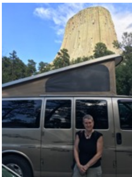
Arrivés au stationnement avant notre courte balade dans le parc

C'est à Gillette WY que nous arrêtons souper et faire une GROSSE épicerie (viande dans congélateur car nous n'avions pas le droit d'en traverser aux USA), car dans le parc, nous prévoyons que les vivres coûteront chers.