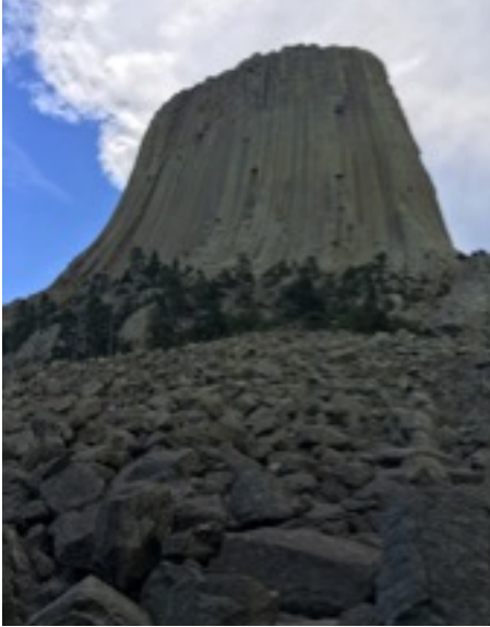
Une autre photo de Devil's Tower