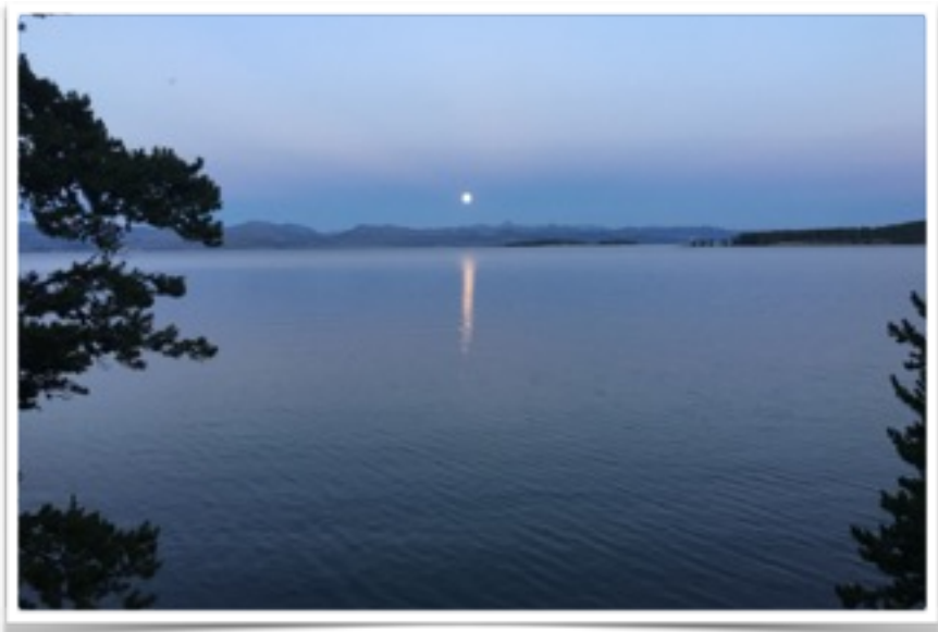
Levée de lune 10 minutes à pied du camping

Enfin bref, tout va bien et demain mardi, journée relaxe au camping pour se reposer de la route et planifier nos 3 semaines dans le parc, à l'aide du guide acheté. Bonne nuit.