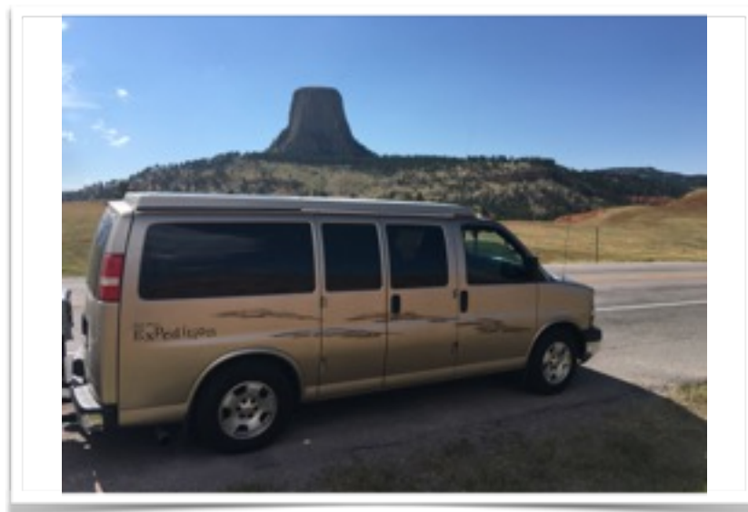
En route vers la Devil's Tower